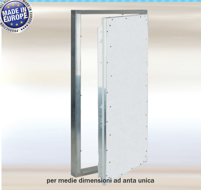
per medie dimensioni ad anta unica